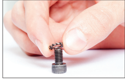
Şekil / Fig. 1

Şekil 1: 4 adet M6 pul rondela, 4 adet M6x10 imbus vidaya geçirilir.