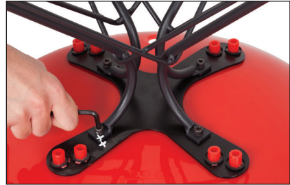
Şekil / Fig. 2

Figure 2: Bring pcs with (x) in leg set and shell on top. Tighten screws with suitable hand tools (like screw drilling or allen).