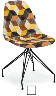
EOS-X Sandalye Chair EOS-X