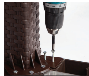
Şekil / Fig. 3

Figure 2:Tighten 3 pcs M4.2×22 button headed self-tapping screws each leg on the inside and 4 pcs M6.3×32 sheet metal screws on each side of leg with suitable handtools (like screw drilling) for 80×80 Antares Table.