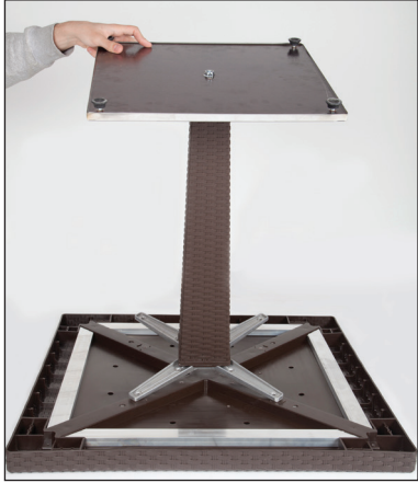
Şekil / Fig. 1