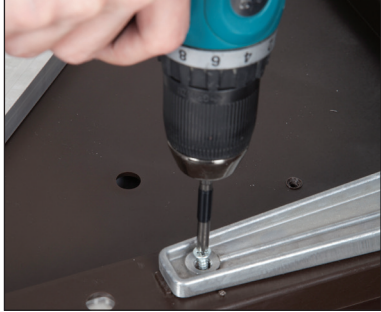
Şekil / Fig. 2

Figure1: Place the aluminium base on the bottom of tabletop aligning with the notches made.