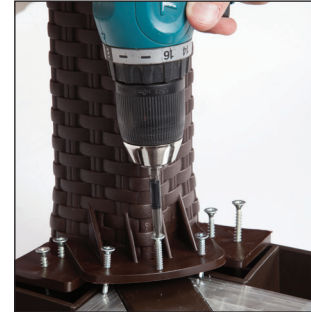
Şekil / Fig. 2

Figure1: Place 4 legs at the corners of plastic tabletop.