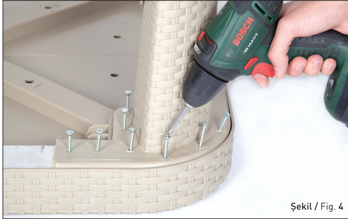
Şekil / Fig. 4

Şekil 4: 90x90 / 90x150 / Ø 110 Osaka Masa için her bir ayağa 12 tane M5x40 sunta vidası takılır ve uygun el aletiyle (matkap gibi) sıkılır.