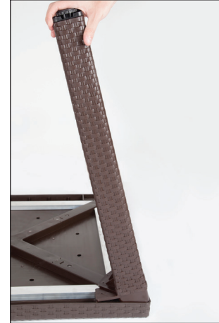
Şekil / Fig. 1